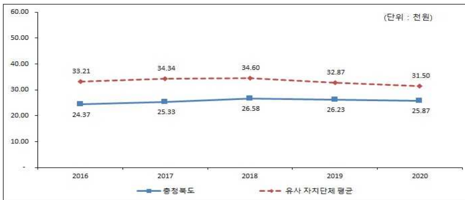
유형 지방자치단체와 재정자립도 비교