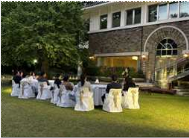
치유와 힐링교육 사진