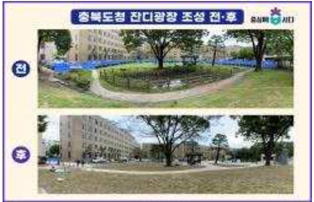
조성 전후 사진