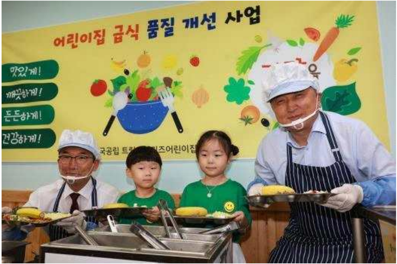
도-교육청 어린이집 배식 활동